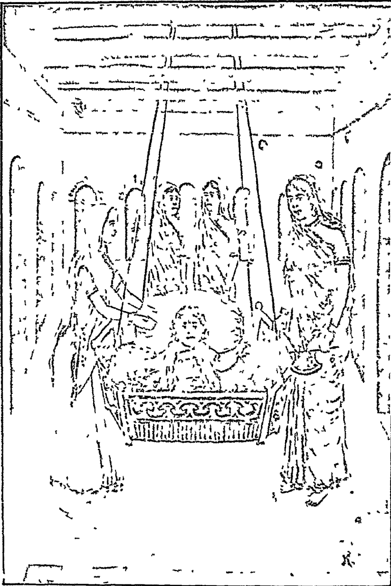
श्रीराम का जन्म